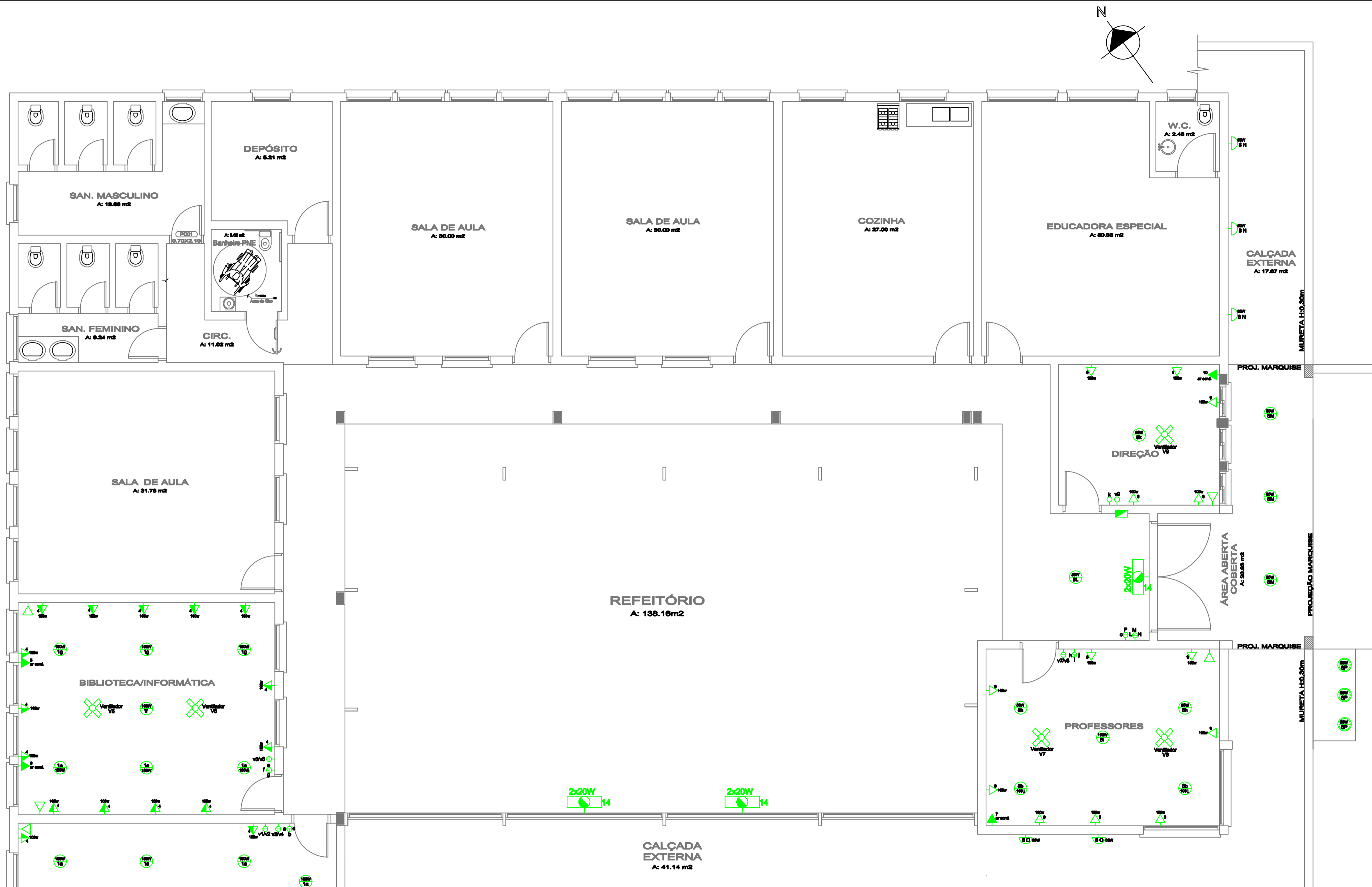
PLANTA BAIXA - Pontos Elétricos ESC: 1/50